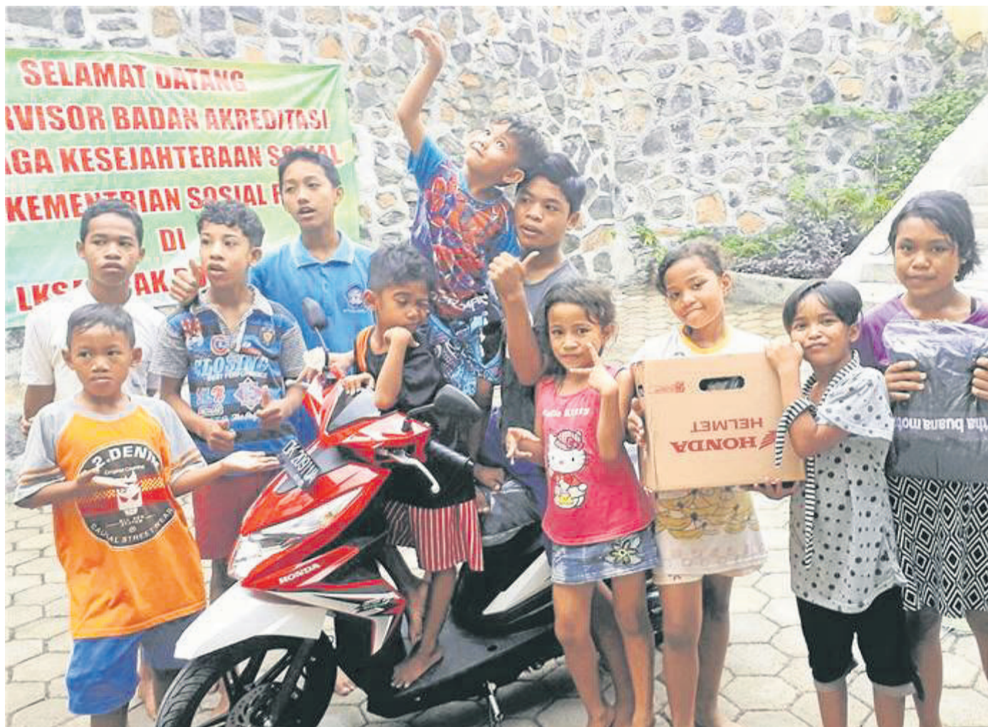
Dank einer Spende konnte für das Waisenhaus ein weiterer Motorroller gekauft werden. Damit werden die Kinder auch zu den Schulen gefahren.

Bei dem Benefiz-Konzert mit der Band Out of Order im Ha-